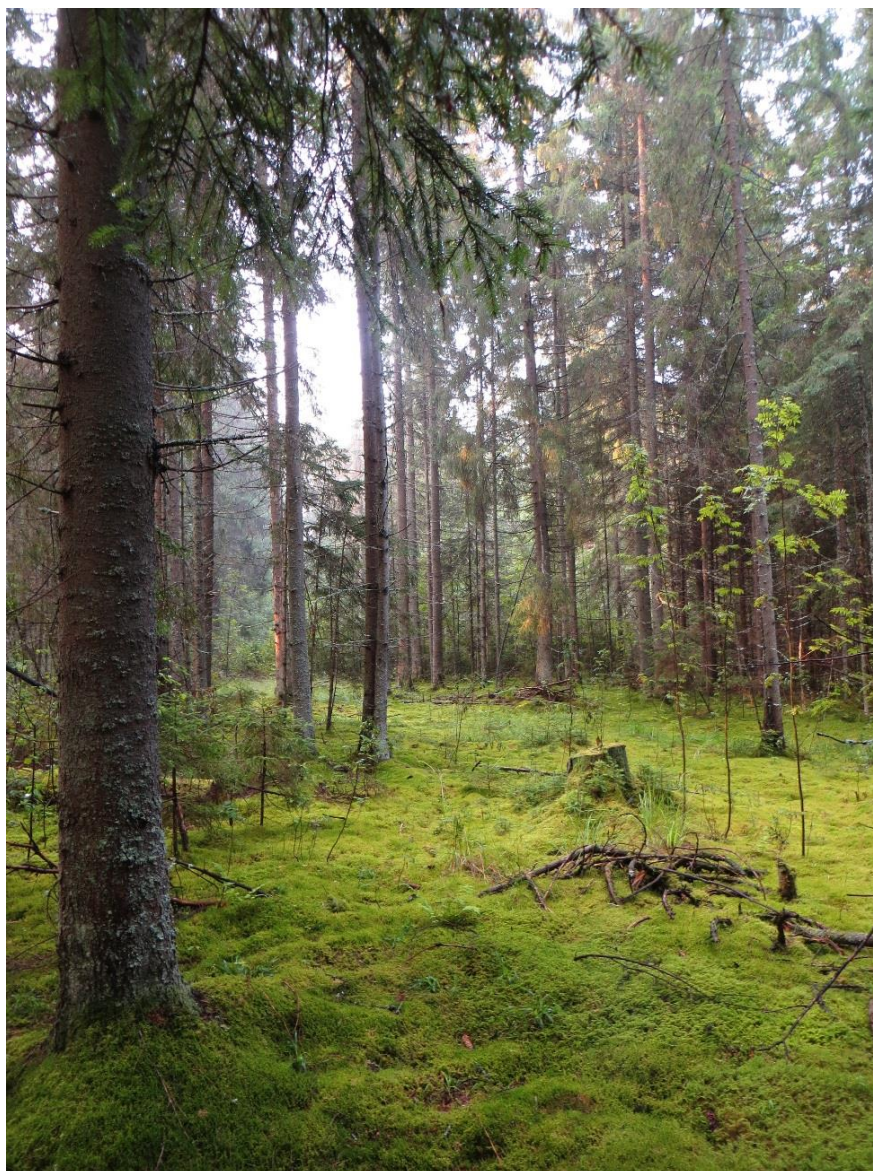
Рис. Дебри лешего.

Место съёмки: Тверская область, Торжокский район, урочище Дерильцы, время съёмки 30.07.16