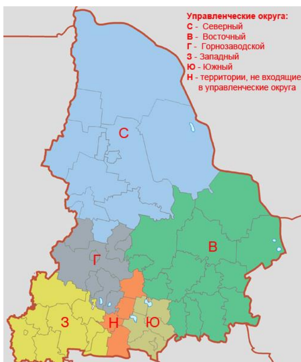
Р и с. 1. Управленческие округа в Свердловской области (2017)

В состав Нижнетагильской ЛСР входят городские округа, которые объединены между собой межселенными социально-экономическими и технико-производственными взаимосвязями – Верхняя и Нижняя Салда, Кушва, Красноуральск, Верхняя и Нижняя Тура, Качканар (рис. 2). Расположенные к югу от Нижнего Тагила города Верхний Тагил, Кировград, Невьянск и Новоуральск по межселенным взаимосвязям тяготеют к городу Екатеринбург как региональному центру. Поэтому мы считаем, что Нижнетагильская ЛСР представляет собой пространство взаимосвязанных поселений, расположенных к северу и востоку от Нижнего Тагила, ограниченное 1,5-часовой изохроной от границ города-центра.