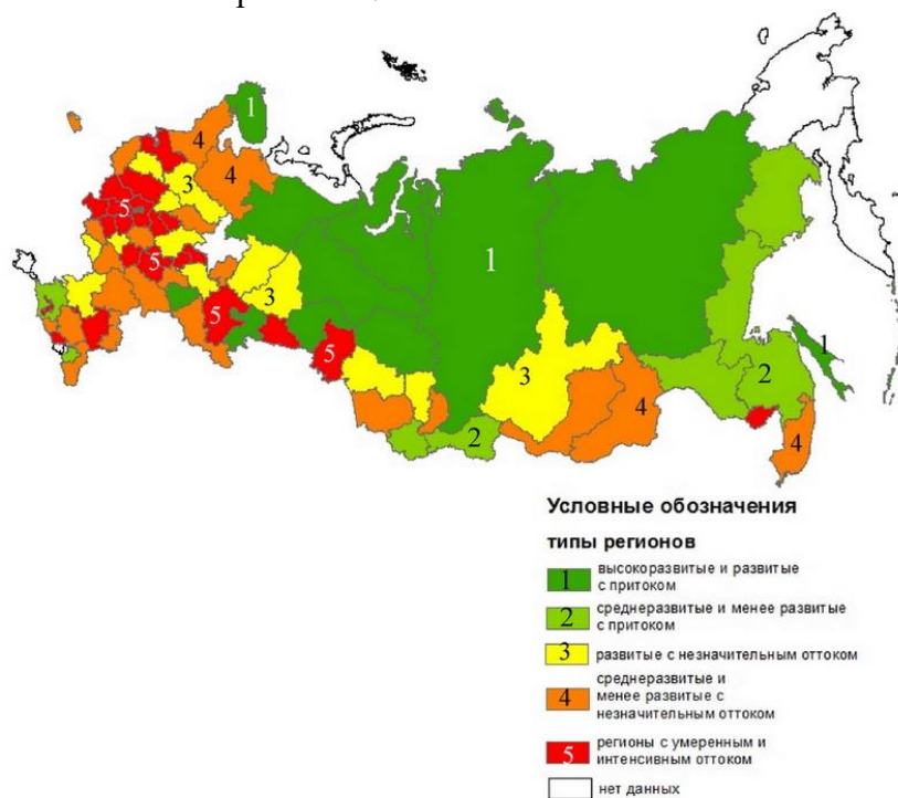
Р и с. 2. Типология регионов РФ по уровню человеческого развития, направленности и интенсивности миграций

Как видно из гистограммы распределения регионов (рис.1), большинство субъектов РФ (44) относится к четвертому и пятому типам, то есть это регионы с оттоком и зачастую с невысоким уровнем человеческого развития (кроме 4). Регионов, где наблюдается несоответствие параметров, то есть отток сочетается с достаточно высоким уровнем человеческого развития и наоборот, немного – 7 регионов во втором типе и 13 регионов в третьем типе, всего 20 регионов. 13 субъектов относятся к первому типу. Таким образом, из 77 регионов, по которым имелись данные, в 53 отмечено соответствие направления миграционного движения (приток или отток) и уровня человеческого развития. Из оставшихся 24 регионов в 15 субъектах несоответствие не имеет резко выраженного характера, то есть регион развитый, но отток незначительный или субъект среднеразвитый, но с незначительным притоком трудовых мигрантов. В 9 регионах несоответствие выражено очень четко: в случае притока в менее развитые регионы или умеренного и интенсивного оттока из развитых и высокоразвитых субъектов. То есть в большинстве регионов России наблюдается соответствие или незначительное несоответствие направления внутрироссийской межрегиональной трудовой миграции и уровня человеческого развития.