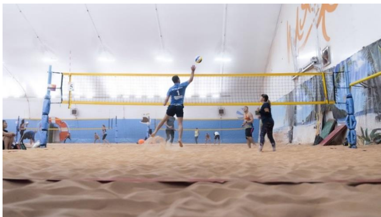
Р и с. 8. Площадка для волейбола в спортивном «Пляже», СПб.

4. Спортивный центр как всесезонный центр пляжного спорта и активного отдыха в спортивных залах, в том числе специальных залах «на песке» 1 : «Лето» 2 , «Жара» 3 , 2x2.team 4 (Москва), «Динамит» 5 , «Пляж» 6 , «Песок» 7 и «Цунами» 8 , GO2SPORT 9 (СПб.), Химки 10 , Королёв 11 , Зеленоград, 12 пос. Вешки 13 (Московская область), Архангельск 14 . Начинается строительство крытого центра пляжных видов спорта в Казани 15 . Для таких центров не нужен классический пляжный берег моря, реки, озера. Кроме волейбола, футбола и тенниса, проводятся Zumba-тренировки (танцы на песке) и др.