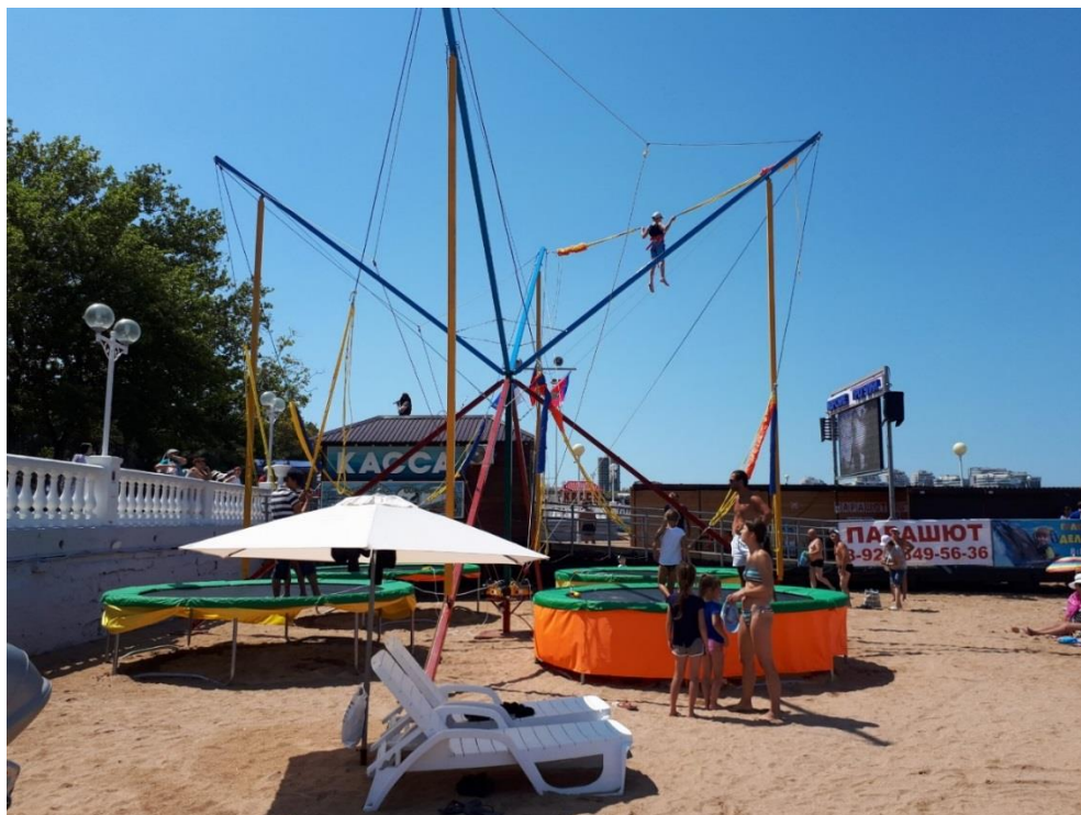
Р и с. 2. Спортивная зона пляжа «Спортивный», Геленджик.