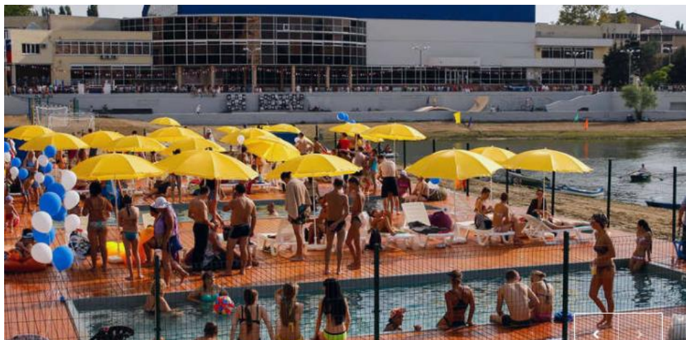
Р и с. 4. Спортивный пляж с бассейнами для купания в Краснодаре.

2. Спортивный пляж в составе спортивного центра. Пример: пляж центра спорта «Эволюция» (Республика Крым, г. Евпатория, пгт. Заозерное) 1 . На территории пляжа действует Евпаторийская школа виндсерфинга/ серфстанция «Свежий ветер» 2 , организовано катание на водных мотоциклах и бананах. Пляжу Центра спорта «Эволюция» официально присвоен синий флаг и 1-я категория.