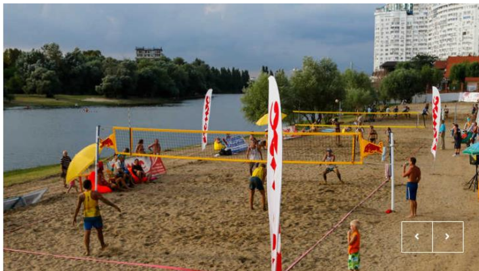
Рис. 3. Волейбольные площадки спортивного пляжа в Краснодаре. Фото: https://krd.ru/novosti/glavnye-novosti/news_13082016_202152.html .