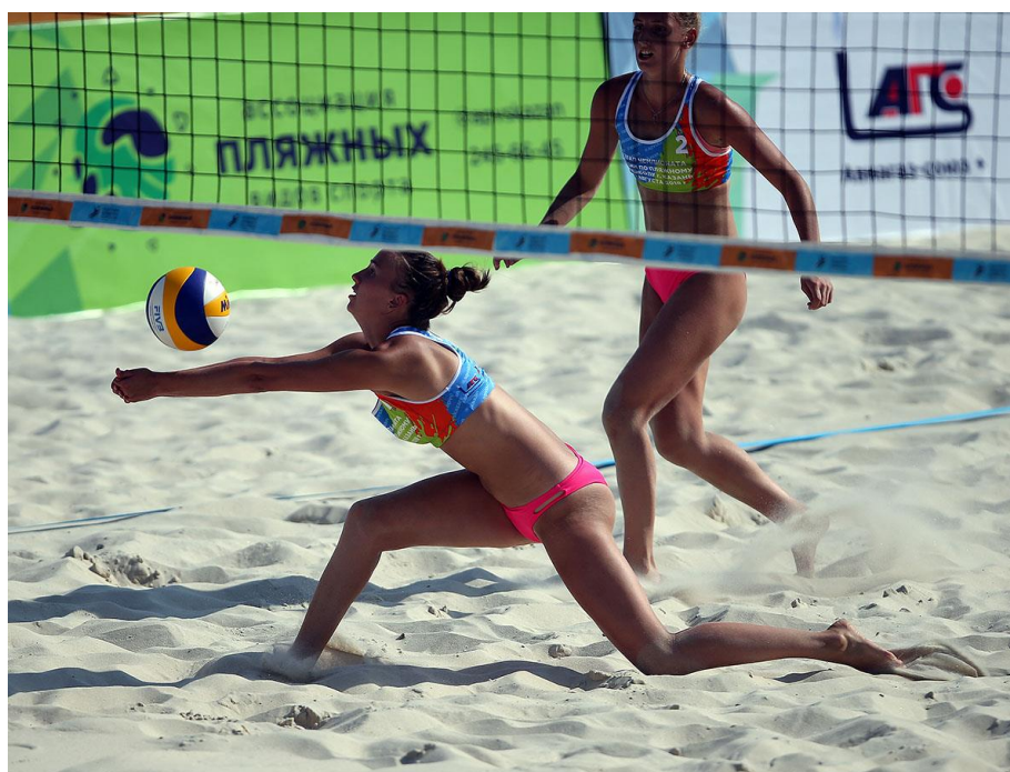
Р и с. 7. Спортивный пляж в Казани, соревнования по пляжному волейболу.