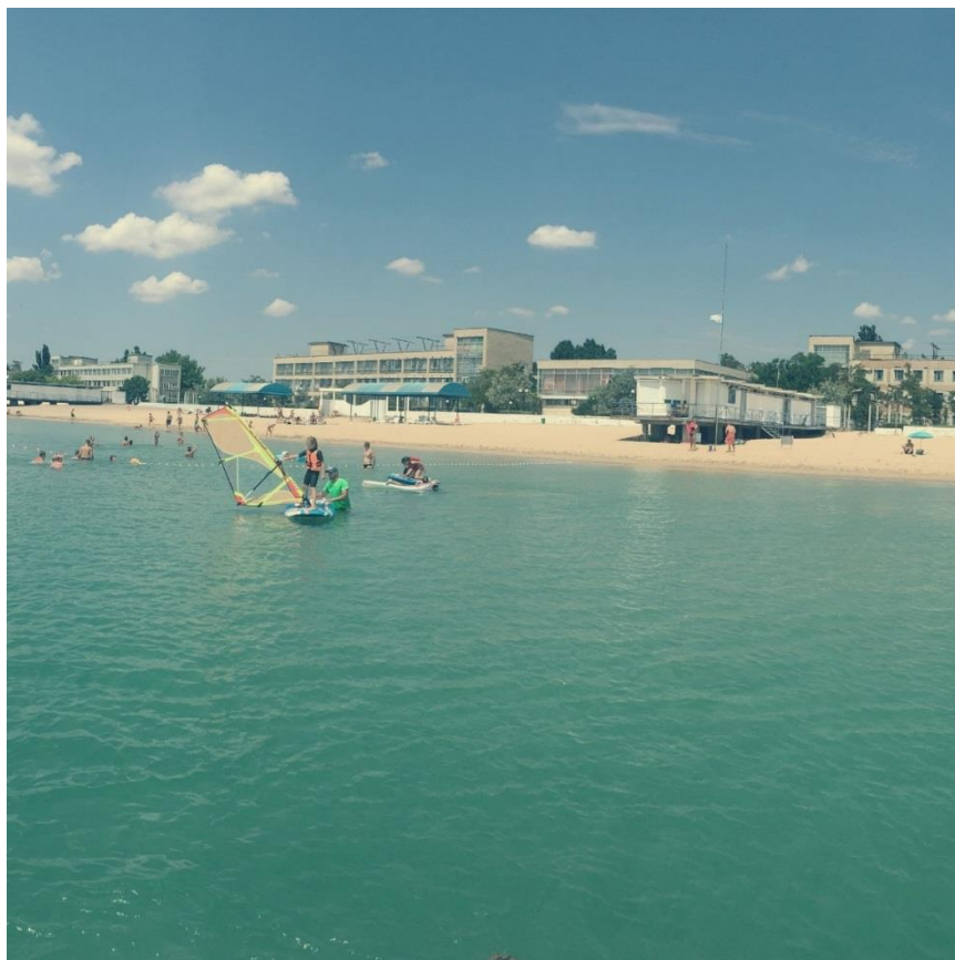
Р и с. 5. Центр спорта «Эволюция» (Евпатория).