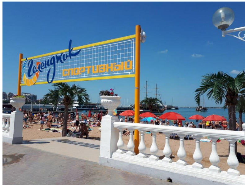
Р и с. 1. Спортивный пляж, Геленджик.

1. Спортивный пляж на берегу моря, реки, озера, водохранилища с системой площадок для спорта, в том числе с бассейнами для купания (Краснодар 1 ), пирсом для организации морских прогулок (Геленджик 2 ). Например, в Челябинске 3 территория спортивного пляжа оснащена площадками для занятий фитнесом, йогой, волейболом и баскетболом, а также теннисным кортом. Для любителей боевых направлений имеется спортивный ринг. Здесь разместилась одна из самых больших в России площадок для воркаута 4 .