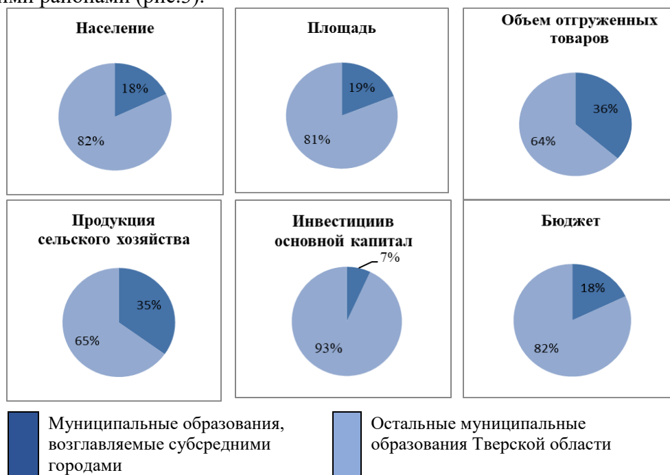
Р и с. 3. Доля муниципальных образований, возглавляемых субсредними городами, по основным социально-экономическим показателям Тверской области

Все города имеют разные административные статусы, например, Удомля, Нелидово и Осташков являются городскими округами в границах бывших одноименных муниципальных районов, а Конаково, Бежецк и Бологое остаются городскими поселениями. В силу этих особенностей показатели для субсредних городов, которые находятся в статусе городских поселений, рассмотрены вместе с возглавляемыми ими районами (рис.3).