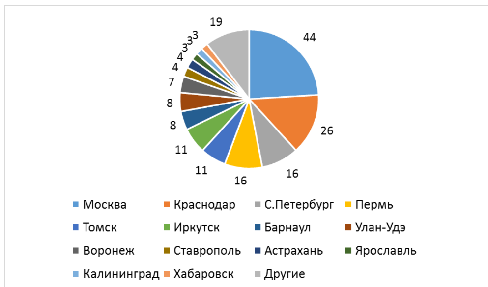
Р и с. 2. Города, в которых проходили защиты туристских диссертаций на ученую степень по географии

Для географической науки всегда интересным является вопрос о территориальном распределении объектов и явлений. Поэтому в нашей работе были выявлены города, в которых проходили защиты туристских диссертаций, претендующих на ученую степень по географии. Результаты поиска частично отражены на круговой диаграмме (рис. 2.).