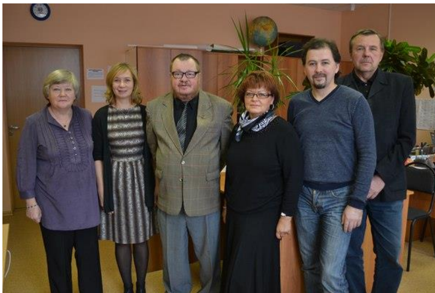
Ф о т о. Первые руководители и сотрудники кафедры туризма и природопользования