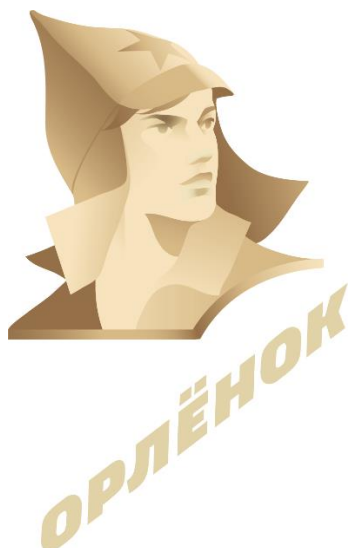
Р и с.1. Логотип «Орлёнка» (в современном формате используется с 2018 г.).

В условиях работы во временном ученическом коллективе в школе ВДЦ «Орлёнок» появляется потребность в дополнительной мотивации обучающихся к изучению предмета с помощью внеурочной деятельности. Интеграция разных предметов даёт обучающимся возможность применить учебные универсальные действия, полученные на разных предметах для достижения единой образовательной цели. Как подойти к изучению темы с точки зрения любимого предмета? Интегрированный подход даёт возможность обучающемуся использовать наибольшее количество инструментов для достижения ученических целей. Задания, связанные с интеграцией предметов, в большей степени отражают жизненный опыт человека. Считаем, что это повышает мотивацию к предмету и положительно сказывается на общем развитии и успеваемости школьника.