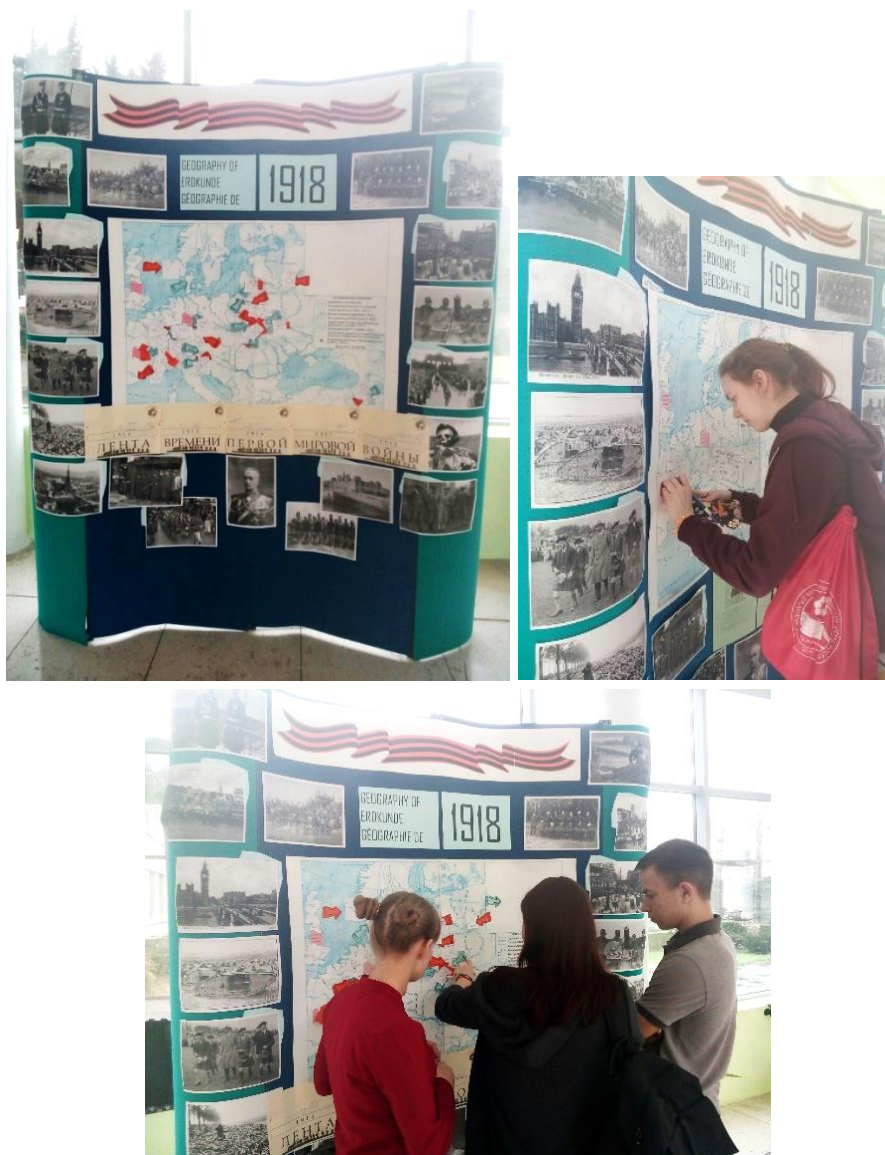
Р и с. 2. Тематический стенд