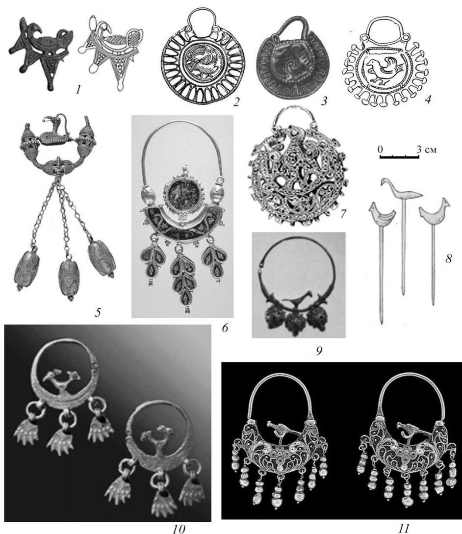
Рис. 2. Ювелирные изделия VIII–XIX вв. с образом птицы.

1 – лучевое височное кольцо, VIII–X вв. (по А. Г. Шпилеву, 2009. Рис. 2: 5); 2 – колт, Киев (по Т.И. Макаровой, 1986. Рис. 22, № 163); 3 – колт, курганный могильник Микулино Городище, XIII в. (по А.А. Спицыну, 1911. Вклейка); 4 – колт (по Т.И. Макаровой, 1986. Рис. 22, № 157); 5 – височная подвеска, Волжская Булгария, X–XIII вв. (по К.А. Руденко, 2011. Рис. 12); 6 – Преславский клад, X–XI вв. (Археологически музей «Велики Преслав». [Электронный ресурс]. URL: https://museum-velikipreslav.com/sakrovishtnica/preslavsko-zlatno-sakrovishte.html ); 7 – колт, Македония (по С.С. Рябцевой, 2005. Рис. 97: 3); 8 – булавки, татарский костюм (по Ф.Х. Валееву, Г.Ф. Валеевой-Сулеймановой, 1987. Рис. 26); 9 – височная подвеска, Дагестан, XIX в. (по Д. Чиркову, 1971. Илл. 16); 10 – височные кольца, Дагестан, XIX в. (Ювелирное искусство народов России, 1974. Илл. 172); 11 – серьги, Россия, XVII в. (Русские ювелирные украшения 16–20 веков, 1994. Илл. 76).