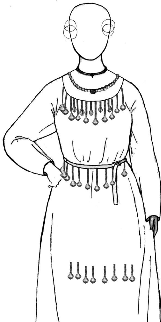
Рис. 2. Реконструкция женского погребального костюма по материалам раскопок кургана № 6 могильника Устье (Тверская обл). Рисунок автора.

Использование раковин каури в costume и в качестве оберегов имеет широкую хронологию и географию. Каури широко использовались в costume населения Древней Руси и соседних территорий (Например, находки из погребений у с. Броварки, Каменное, в Гродно и др.). В научной литературе каури рассматриваются как символы плодородия, женственности, рождения, как апотропеический амулет, предназначенный для оберегания от сглаза 24 , а также как символ, связанный с христианством 25 .