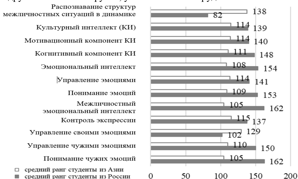
Рис. 2. Сравнение интеллектуальных проявлений у студентов из России и стран Азии

сочувствие соплеменников, но с пониманием чувств людей, относящихся к другой этнической группе, у них возникают трудности.