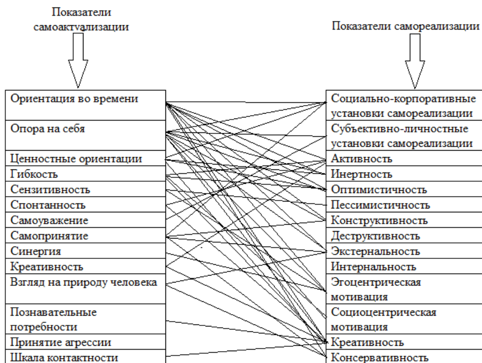
Рис. 1. Корреляционные связи показателей самоактуализации и самореализации