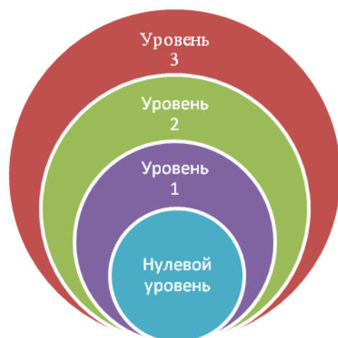
Рис. 2. Структура процесса изучения математических дисциплин согласно SEFI

программе. Этот уровень содержит материал, который образует прочную платформу, на которой строится изучение математических курсов для инженерных направлений в университетах и высших школах; в его знании и понимании допускаются лишь незначительные упущения. Для анализа сформированности компетенций данного уровня может проводиться входное тестирование, что позволяет вузам организовать выравнивающие курсы, ликвидирующие пробелы в знаниях студентов.