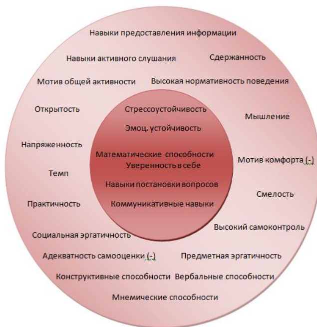
Рис. 1. Эмпирическая модель психологических ПВК успешного специалиста СП

В ходе проведенного анализа литературы определено, что исследования, посвященные данному вопросу применительно к профессиональной деятельности специалиста СП, отсутствуют. В связи с этим в рамках данного исследования была построена эмпирическая модель психологических профессионально важных качеств (далее ПВК) успешного специалиста СП. В данной модели нашли свое отражение все структурные составляющие ПВК: общие и профессиональные способности, профессиональный опыт, общетрудовая и профессиональная мотивация, профессиональные личностные качества (рис. 1).